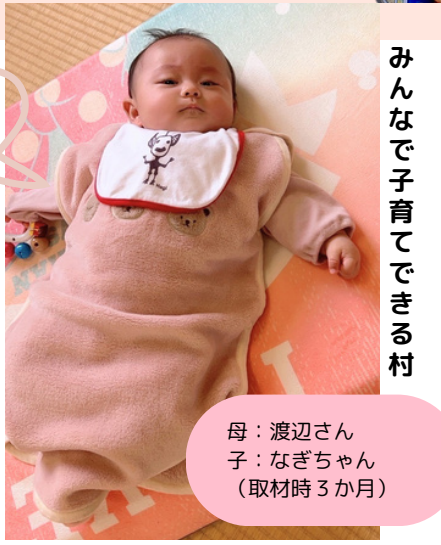
みんなで子育てできる村