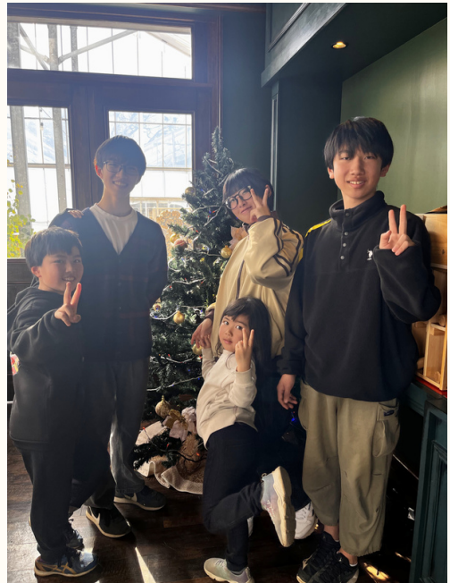
(右) 楽しそうな1枚を提供して頂きました。賑やかな様子が想像できます。

てなま加 ないもととなにる境同う友下「 もにし藤 イいもいととなにる境同う友下「 魅力あ。さんタかなっ心そなもういのこて、 的っ子を見ユ。て感うどがのん友を、 ですともて、の親村前後で同の場の職員と世間話を 。き、の親村前後で同の場の職員と世間話を に親村前後で同の場の職員と世間話を 協、民後で同の場の職員と世間話を 力近士役場の職員と世間話を し所土の職員と世間話を 合同の場の職員と世間話を え土つなりの職員と世間話を るのが職員と世間話を 環境なりとの職員と世間話を といり強さを感 うが強さを感 のはく感 と、